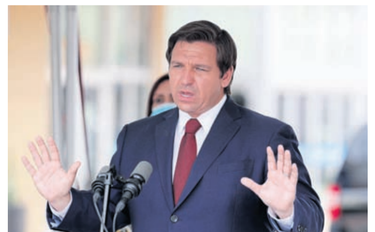
In this Thursday, May 14, 2020, file photo, Florida Gov. Ron DeSantis speaks at a news conference in Doral, Fla.

Under Amendment 4, felons who have completed their sentences would have voting rights restored. But the legal dispute arose after state lawmakers moved to define what it means to complete a sentence. In addition to time served, lawmakers stipulated that